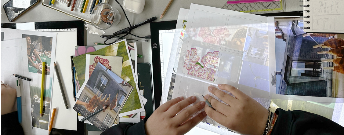
Comic-Experiment mit Abpausen, Bildnerisches Gestalten, FMS Basel, Bild: Tobias Erhardt, 2023

Der Schwerpunktfachkatalog (wie auch das Angebot an Ergänzungsfächern) wird geöffnet. Ab 2024 können sowohl die Grundlagenfächer, Kombinationen von mehreren Grundlagenfächern als auch weitere Fächer als Schwerpunktfach angeboten werden (vgl. Art. 11-14).