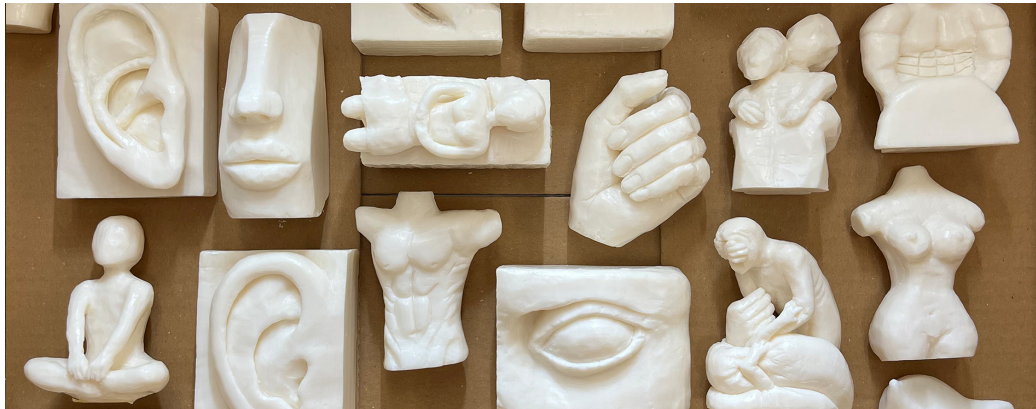
Seifenskulpturen zur menschlichen Figur, Kantonsschule am Burggraben St. Gallen, Foto: F. Affentranger, 2022

Hier geht's zur VSG Vernehmlassungsantwort Hier geht's zu allen 139 Vernehmlassungsantworten