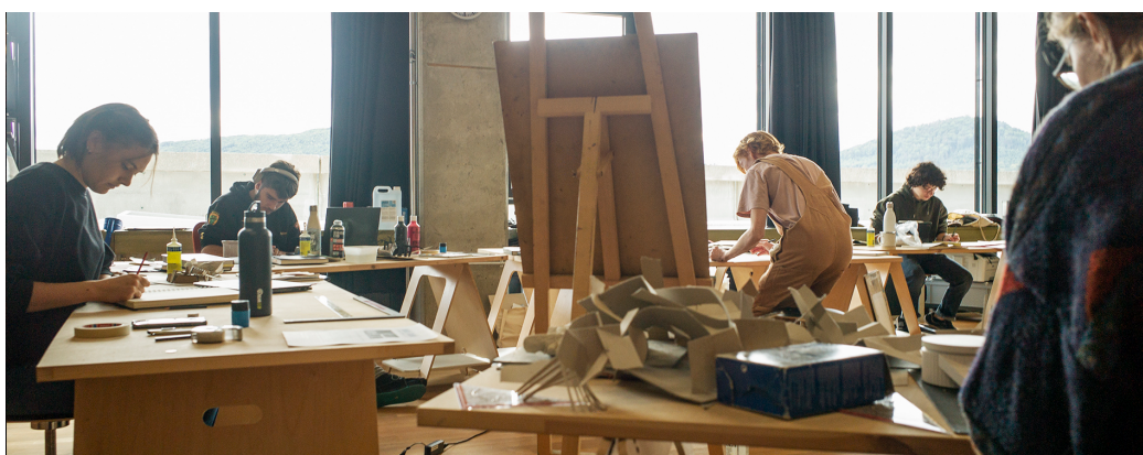
BG-Unterricht an der Kanti Olten: Atelier des 4. Gym im Schwerpunktfach, Foto: Ch. Schumacher, 2022

Hinweise für eine weiterführende Lektüre: Melanie Keim spricht mit Dominik Petko über «einen stillen Wandel der Unterrichtskultur an den Gymnasien und die Herausforderungen der neuen Maturitätsreform»: «Guter Unterricht braucht Freiräume» (18.08.2022). Der Artikel von Cyrielle Cabot thematisiert eine gesamt-europäische Perspektive: Entre difficultés de recrutement et démissions, l'Europe en manque de professeurs (26.08.2022)