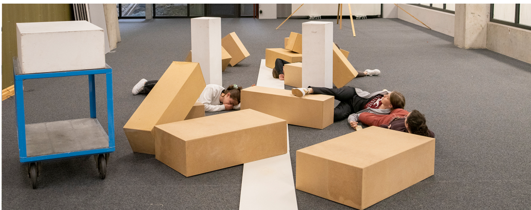
BG-Unterricht an der Kanti Olten: 2. Gym im Gang mit Ausstellungssockeln, Foto: Ch. Schumacher, 2022

Der LBG/VSG-BG hat sich im Rahmen der Weiterentwicklung der gymnasialen Maturität ( WEGM ) mit den Vorschlägen für die neue Maturitätsanerkennungsverordnung MAV bzw. für das neue Maturitätsreglement MAR intensiv auseinandergesetzt und eine gemeinsame Vernehmlassungsantwort verfasst. Dazu konnten in einer Umfrage unsere Mitglieder beider Verbände ihre Meinung einbringen und somit die LBG/VSG-BG-Vernehmlassungsantwort mitgestalten.