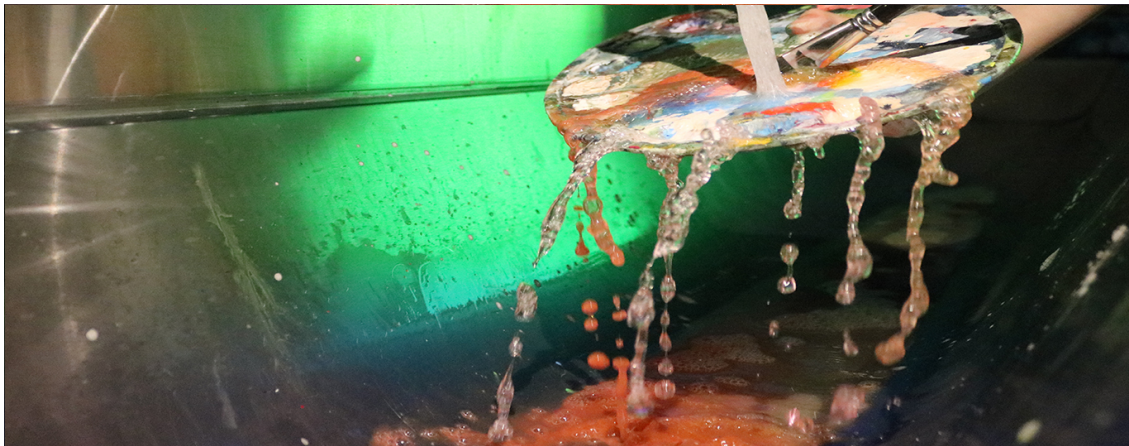
Fotografie von Anja Rothlin/Fabiana Rusch, 3. Klasse Gymnasium, Kantonsschule Wohlen, 2021

Weitere Informationen zum Programm, der Aufruf zur Mitarbeit am “Marktplatz” (Eingabefrist 31.01.2022) sowie das Anmeldeformular finden sich auf der Tagungswebsite .